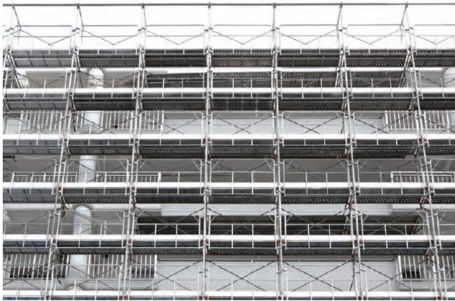
国土交通省・厚生労働省「手すり先行工法に関するガイドライン」適合製品